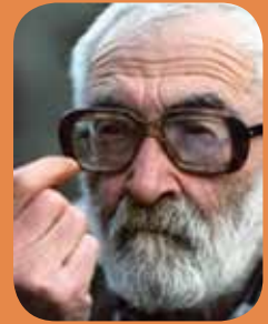
(1933-2012) ქართველი მწერალი და სცენარისტი. ლიტერატურული პრემია „საბას“ ლაურეატი