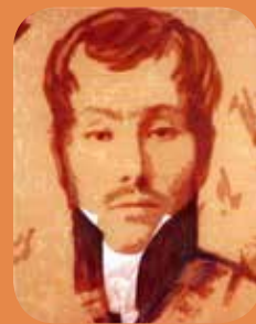
(1817-1845) ქართველი პოეტი, რომანტიზმის გამორჩეული წარმომადგენელი